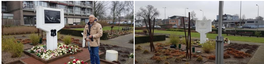
Monument HONI Den Bosch

Vrijdag 16 maart zijn de secretaris en de penningmeester op (werk)bezoek geweest bij vereniging HONI '42 -'49 te Den Bosch. Zij hebben ons inzicht gegeven in hun aanpak en begroting en ons tips en adviezen gegeven hoe wij het beste ons initiatief kunnen realiseren.